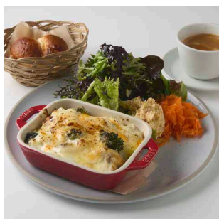
PLATE LUNCH プレートランチ 11:00-14:30 L.o.

Coffee or Tea or Herb Tea or Orange Juice