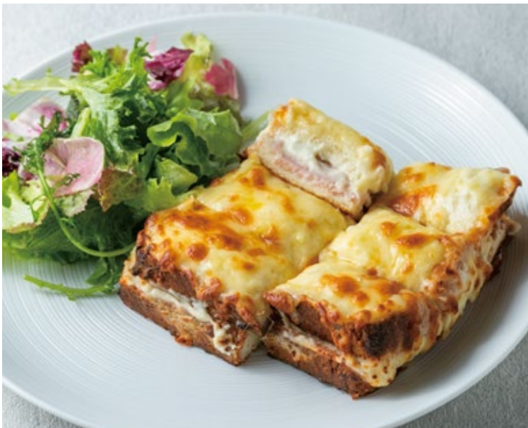
クロックムッシュ 1050 Croque monsieur 生クリームとグリュイエールチーズの自家製ベシャメルソースを挟みました