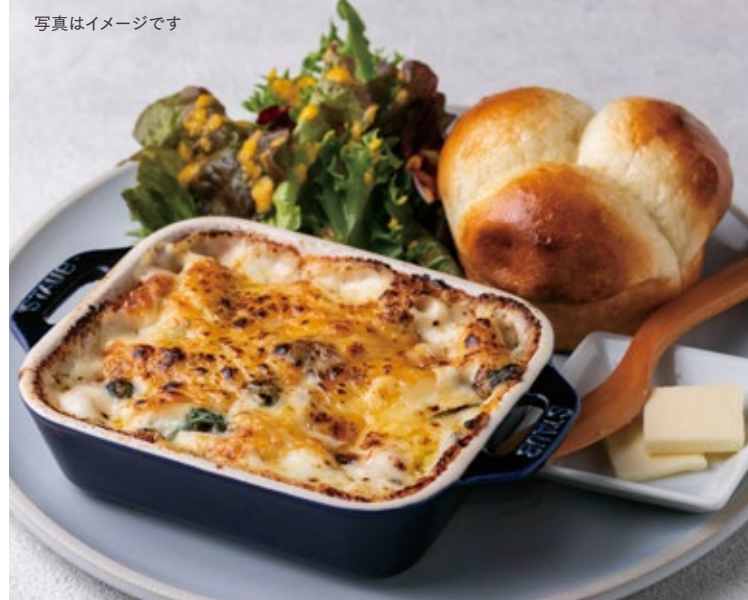
写真はイメージです マンズリーグラタンプレート 1200 Monthly Gratin Plate マンズリーで変わるグラタンソース、マカロニにたっぷり絡めてどうぞ!