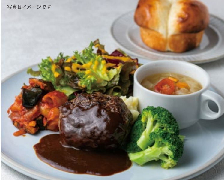
写真はイメージです パラディマンズリープレート 1300 Paradis Monthly Plate パラディのパンに合わせて作るメイン料理は、毎月変わります!