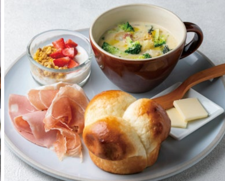
スーププレート 1100 Soup Plate クラムチャウダーと湯種パンに少しずついろいろな楽しいランチプレートです